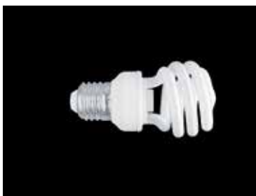
Lámparas fluorescentes compactas