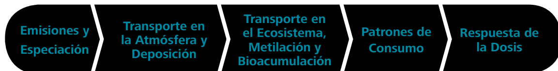
Ilustración 1. Cadena ilustrativa de entrada del mercurio al ambiente y seres humanos.