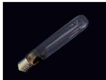
Lámparas de descarga de alta densidad