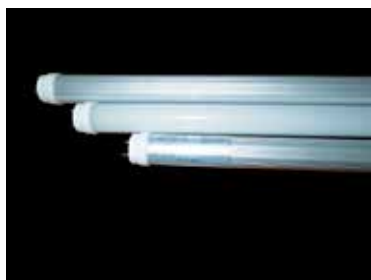
Lámparas fluorescentes tubulares

Las lámparas fluorescentes pueden ser de los siguientes tipos: