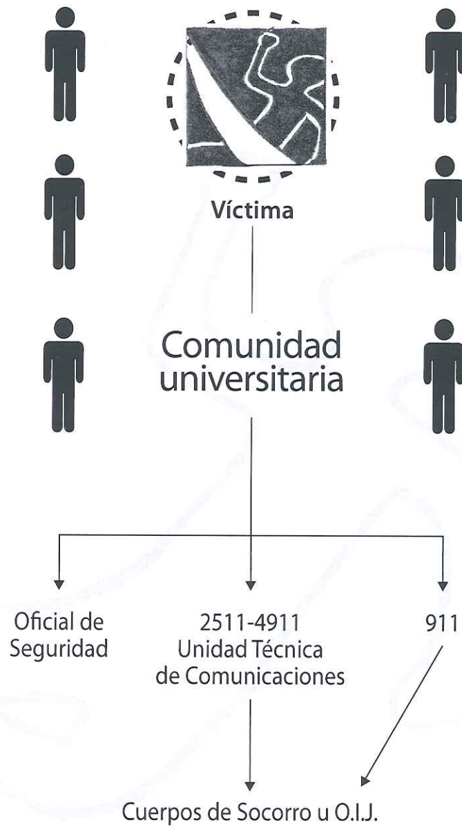
Diagrama de coordinación con entes externos